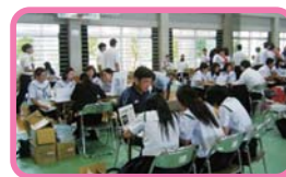
校内進路ガイダンス