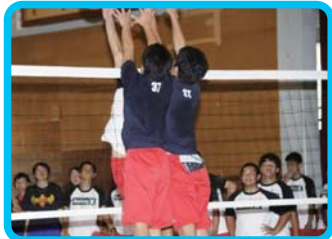
新入生歓迎球技大会