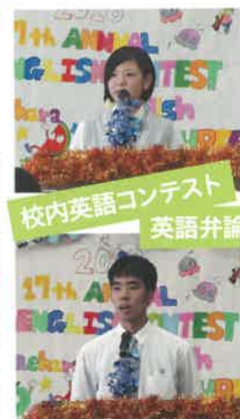
校内英語コンテスト 英語弁論