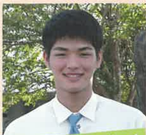
オールマイティーボーイ