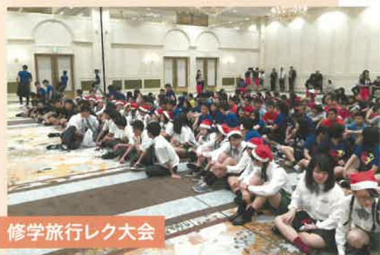
修学旅行レク大会