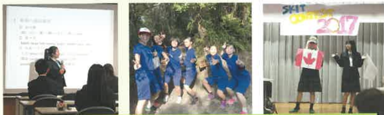
1年生宿泊研修:名桜大での英語講座・ウォークラリー・スキットコンテスト