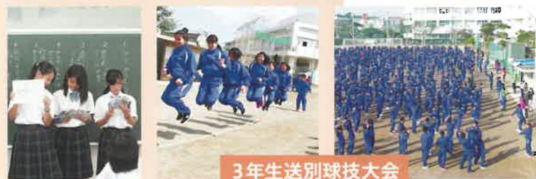
3年生送別球技大会