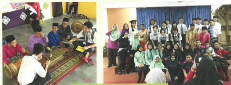
2年海外研修:現地校交流