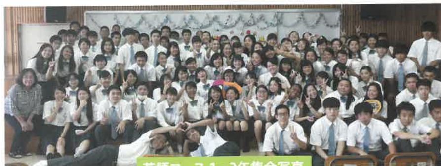
英語コース 1~3年集合写真