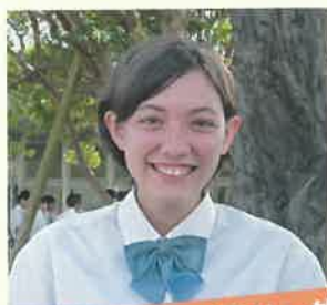
前高のグローバルリーダー