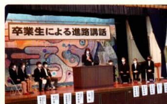
合格・内定体験発表