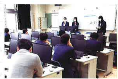
国際探究Ⅰ研究発表会