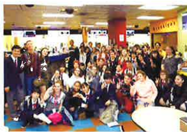
カテナハイスクール訪問