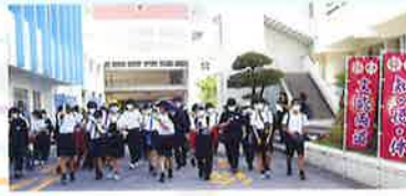
リーダー育成行事 新入生歓迎ウォークラリー