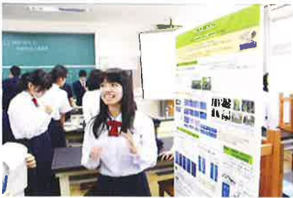
SSHポスターセッション