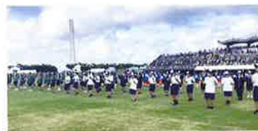
第1回球炎祭:団体競技