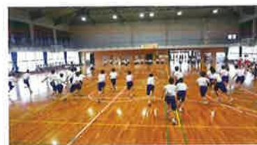
中学部レク(Qリンピック)